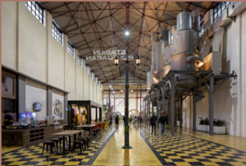
Stasiun Gilingan yang diubah menjadi Museum Pabrik Gula.

berkunjung. Sebagai contoh, Stasiun Gilingan difungsikan sebagai Museum Pabrik Gula, Stasiun Ketelan dan Besali Cafe difungsikan sebagai Pujasera dan Cafe, Stasiun Penguapan diubah menjadi Area Arcade, dan Stasiun Karbonatasi sebagai Area Pameran Kerajinan Lokal.