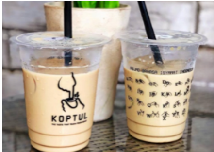
Kemasan kopi yang menjadi media pembelajaran bahasa isyarat tunarungu.