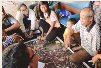
Pelatihan termasuk diskusi dengan masyarakat mengenai isu dan peluang.

Urban Citizenship Academy (UCA) merupakan sebuah program pelatihan yang diinisiasi oleh Yayasan Kota Kita, yang berlokasi di Solo, Provinsi Jawa Tengah. Program ini menyasar kaum muda dan profesional dan bertujuan untuk mengajak kaum muda untuk lebih aktif dan inovatif dalam berkontribusi mencari solusi dari serangkaian masalah perkotaan. Pelatihan ini bermula dari sebuah pemikiran dimana kaum muda tidak hanya merupakan generasi penerus bangsa namun juga merupakan calon pengambil kebijakan yang seyogyanya perlu dipersiapkan secara matang dalam menghadapi realita kompleksitas isu perkotaan. Program ini berlangsung