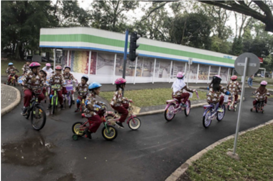
Anak-anak dapat belajar bersepeda dan peraturan lalu lintas di taman ini.