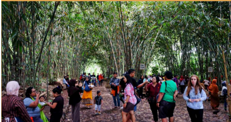
Suasana Pasar Papringan Ngadiprono yang terletak di tengah hutan bambu.