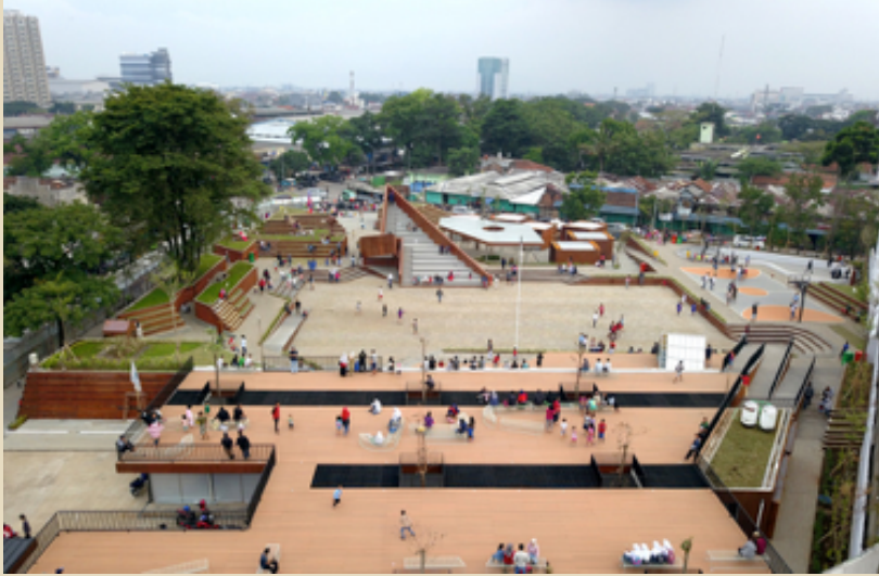
Gambar penampakan Alun-Alun Cicendo, Bandung.