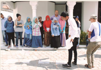
Aktivitas pelatihan Urban Citizenships Academy.