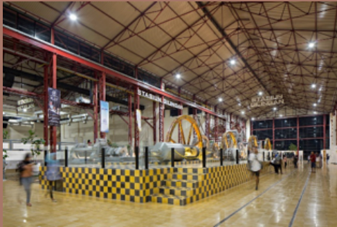
Stasiun Penguapan yang difungsikan sebagai area pujasera